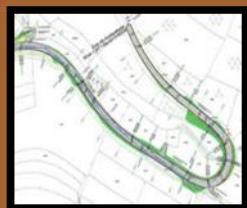
• Projektierung & Vermessung