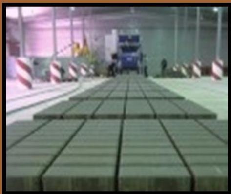
GALA - LUSIT LITHONPLUS