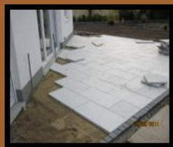
• Terrassen- & Wegebau