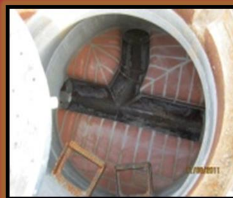
KANN BAUSTOFFE BERDING BETON