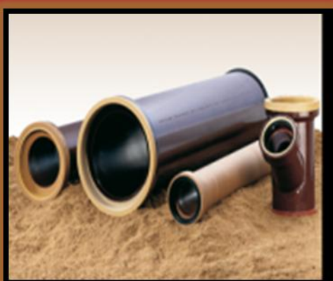
REHAU AG DEUTSCHE STEINZEUG AG