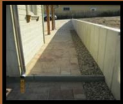
• Gebundene & ungebundene Befestigungen